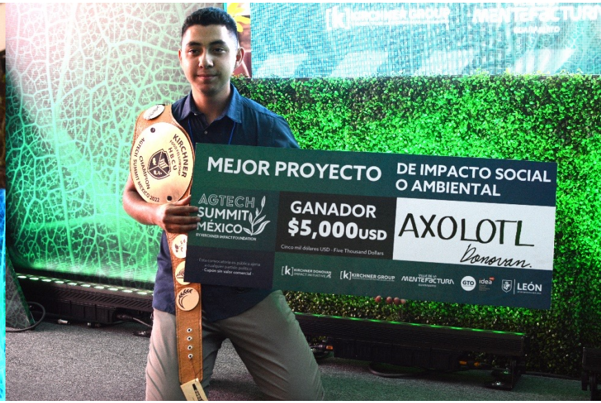
MEJOR PROYECTO DE IMPACTO SOCIAL Y/O AMBIENTAL