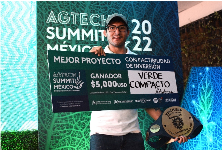
MEJOR PROYECTO CON FACTIBILIDAD DE INVERSIÓN