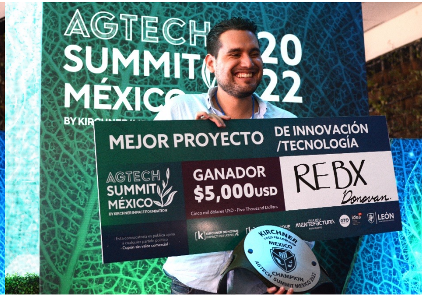
MEJOR PROYECTO DE INNOVACIÓN TECNOLÓGICA